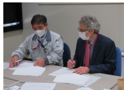
Visit Summary への署名

1 日目と 2 日目の監査内容を踏まえて訪問チームが作成した是正要求事項と是正推奨事項のリストを基に、各項目の具体的な対応策について討議を実施し、是正措置を完了する期限を設定した。最終的には、是正措置の期限が記されたリストが完成し、両者の合意に至った。