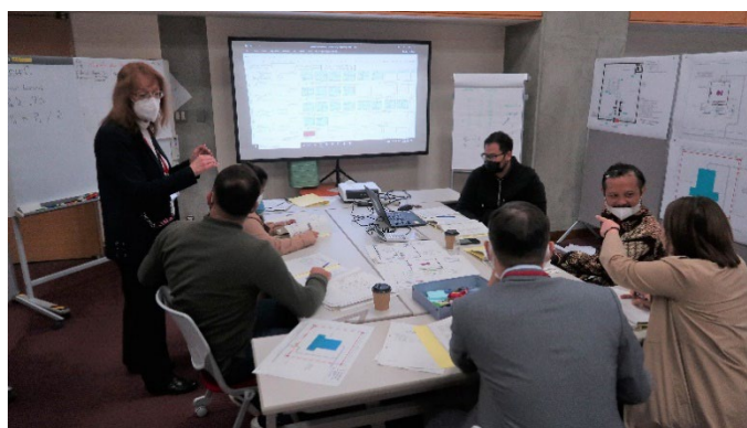
グループ演習の様子

(本コースは10月28日(木)にNHKの取材を受けました。内容は以下URL参照。) https://www.jaea.go.jp/04/isn/activity/2022-10-27/index.html