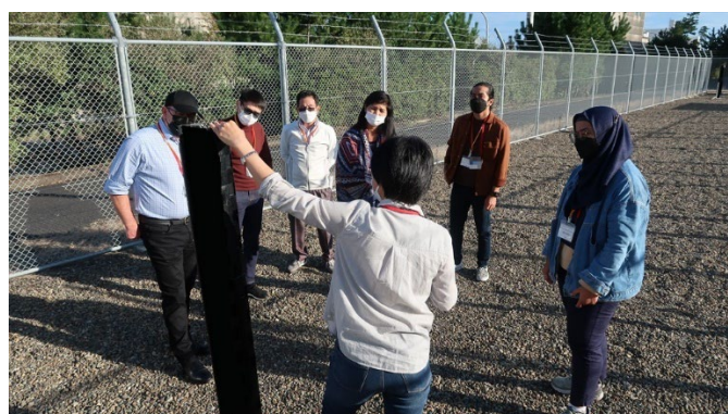
PPフィールドでのセキュリティ機器を用いた実習の様子